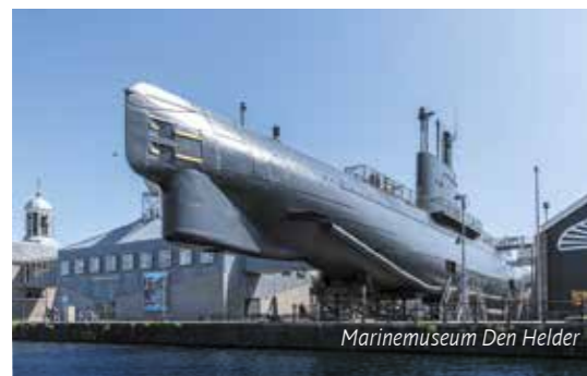
Marinemuseum Den Helder

Den Helder, een vestingstad aan zee, met een onuitwisbare en onbetwiste geschiedenis en traditie. Bezoek Den Helder en beleef cultuur in de vorm van forten, bunkers, kunst, verhalen, musea, stranden, duinen, bos, vaartochten en nog veel meer.