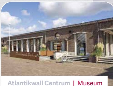
Atlantikwall Centrum | Museum