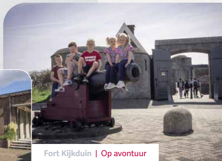
Fort Kijkduin | Op avontuur