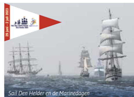
Sail Den Helder en de Marinedagen

Het nautisch evenement van 2023 vindt plaats in Den Helder. Tijdens Sail Den Helder van 29 juni t/m 2 juli doen zo'n 40 grote Tall Ships de haven van dé marinestad van Nederland aan en liggen er naast deze imposante Tall Ships ook vele andere schepen uit het Varend Erfgoed. Sail Den Helder wordt gezamenlijk georganiseerd met de Marinedagen, waar je een kijkje in de keuken van de Koninklijke Marine krijgt. Kijk voor een volledig overzicht van het toeristisch aanbod in Den Helder op www.denhelder.online .