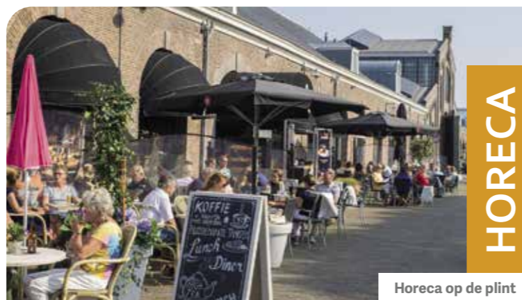
Horeca op de plint

Kortom: een bezoek aan Willemsoord staat garant voor een gezellig dagje uit!