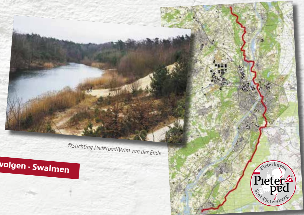
Swolgen - Swalmen

De etappes van het Pieterpad zijn eenvoudig te volgen. In de eerste plaats zijn de wegen en paden uitstekend bewegwijzerd (de wit-rode markering). Daarnaast zijn er via de officiële website GPX-bestanden te downloaden die je op je telefoon of GPS-apparaat kunt laden en volgen. Tenslotte zijn er nog de routeboekjes. Naast heldere routebeschrijvingen en kaartjes bieden deze een grote rijkdom aan wetenswaardigheden over cultuurhistorie, landschap en bezienswaardigheden langs de route. Zeker als je van plan bent meerdere etappes van het Pieterpad te lopen, is het aan te raden deze aan te schaffen; met de opbrengsten wordt het pad onderhouden.