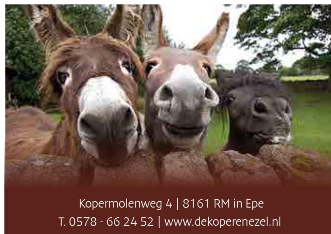
Kopermolenweg 4 | 8161 RM in Epe T. 0578 - 66 24 52 | www.dekoperenezel.nl

Het meest bijzondere van De koperen ezel is dat je er ook op pad kunt met een ezel. Ezels zijn lief, zachtvaardig en ze lopen niet zo snel. Maak er je eigen feest van want je kunt ervoor kiezen om een picknick mee te nemen, een zadel op de ezel te laten zetten of een huifkar achter de ezel te plaatsen! Uitrusten kan op ons boerenterras of in het eetcafe!