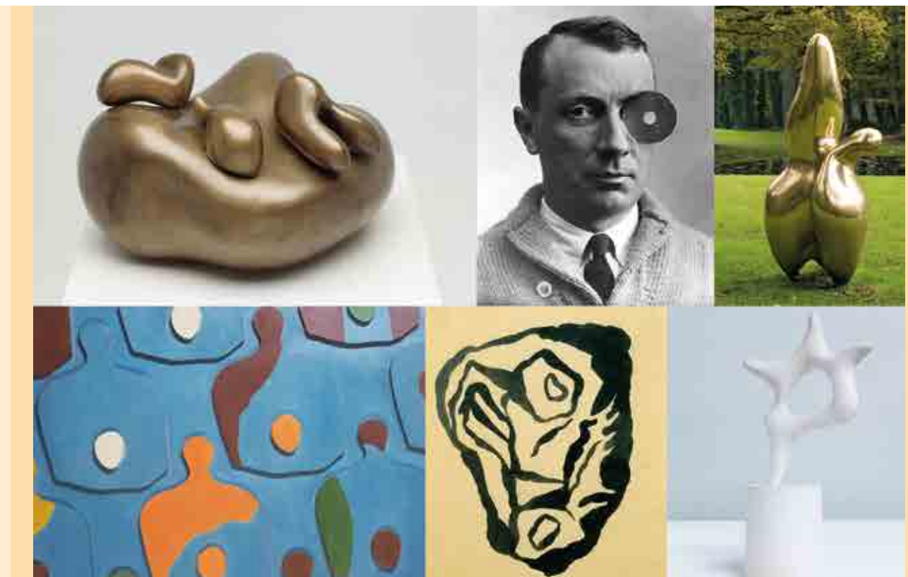
Collage met werken van Hans (Jean) Arp (1886-1966)

Met ruim honderd werken is The Poetry of Forms de eerste grote overzichtstentoonstelling van Arp in Nederland sinds 1960 (Stedelijk Museum, Amsterdam).