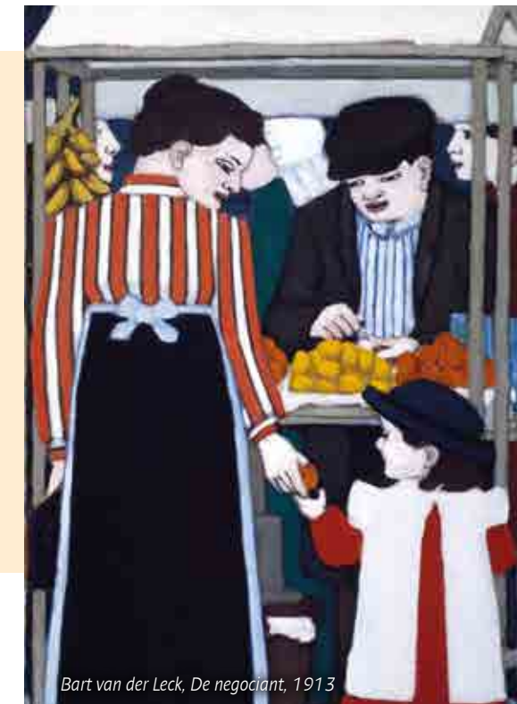
Bart van der Leck, De negodant, 1913

meest innovatieve en invloedrijke kunstenaars van de Europese avant-garde. Tot zijn omvangrijke netwerk behoort ook Theo van Doesburg, oprichter van De Stijl. Samen met Van Doesburg en met zijn echtgenote Sophie Tauber-Arp werkt Arp in de jaren 1926-1928 aan de herinrichting van het interieur van